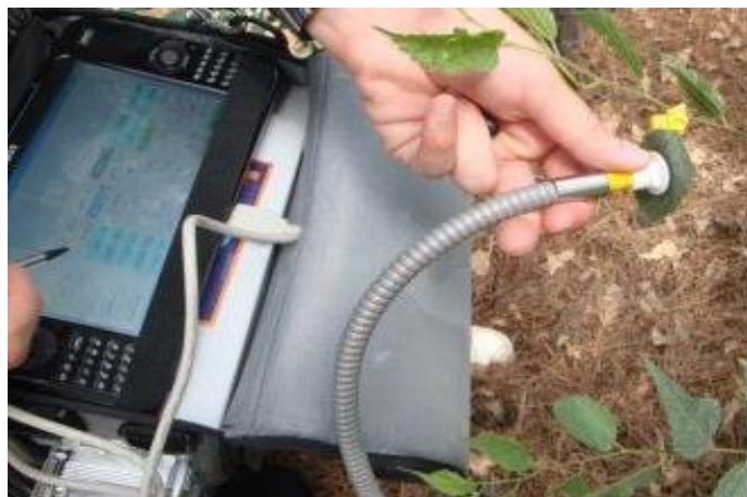
شکل ۱- نحوه اتصال کلیپس به برگ و اندازه‌گیری فلورسانس کلروفیل با استفاده از فیبر نوری دستگاه فلورسانس متر PAM 2500